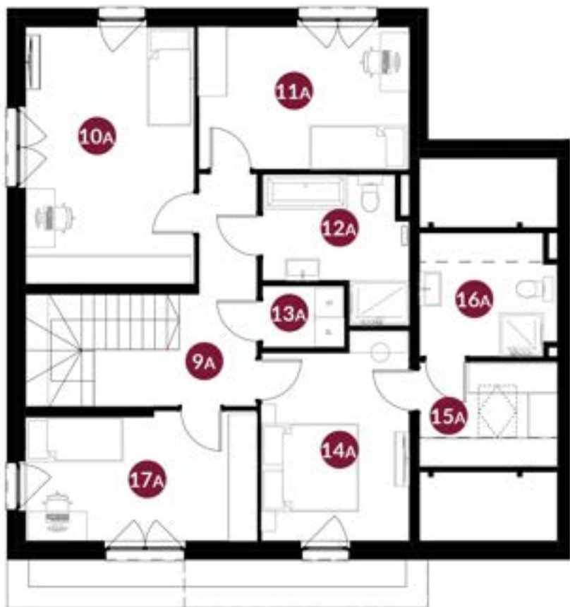
rzut poddasza nieużytkowego